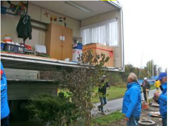
... wird aufgeladen