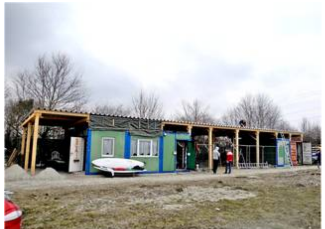
Super: Das Dach ist (fast) fertig