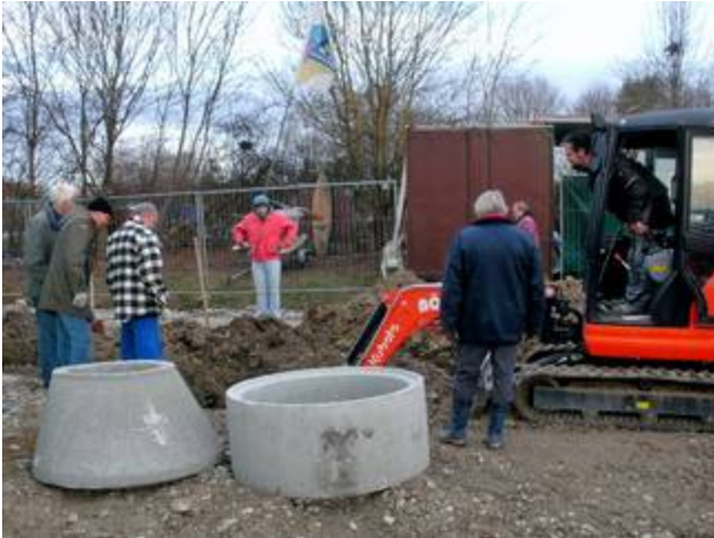
Arbeiten am ersten Versorgungsschacht

Gegen Mittag wurde es deutlich wärmer. Da hatten wir Sonnenschein mit Föhnblick auf die Alpen. Insgesamt waren dann sieben SCA-Helfer, zeitversetzt, am See. Zwischendurch mussten wir und die Seglerkameraden vom KSC warten bis die Baggerarbeiten weitere Tätigkeiten zuließen. Aus diesen Grund waren wir bis um 17 Uhr am See. Da war es fast dunkel. Kurz vorher, so gegen 16:30 Uhr erlebten wir mal wieder einen super kitschigen Sonnenuntergang.