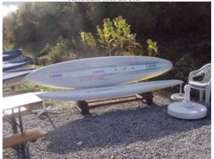
Surferbank auf der Kiesfläche

Hier war es schon schön. Optimal für uns, mit extrem kurzen Wegen zum Ufer.