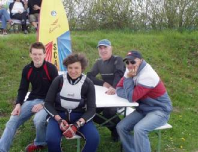
Brotzeittisch am Ufer