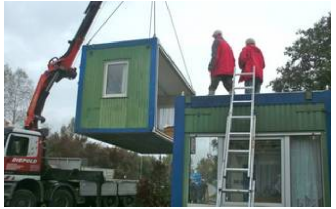
Der erste Teil schwebt weg .....