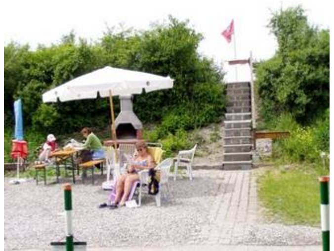
Aufrigg Kiesfläche und Friiplatz