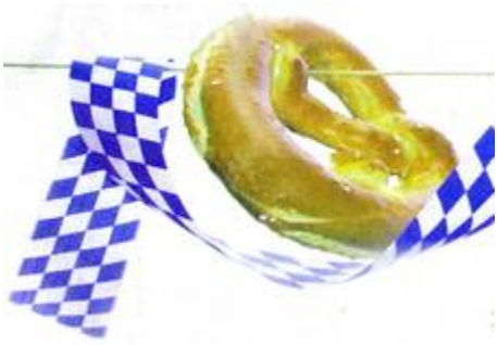
Wir machen Brotzeit