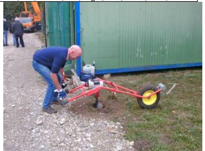
Hier werden die Fundamentlöcher für das Surfständerdach gebohrt