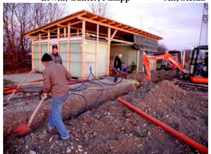
Im Abendrot Arbeit an der KSC-„Backskiste“