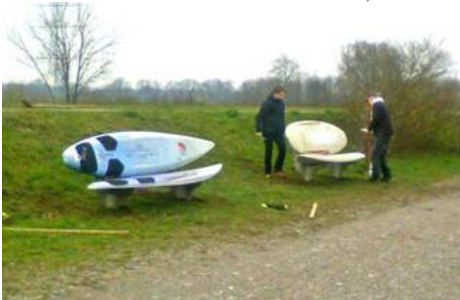
Kurz vor dem Probesitzen