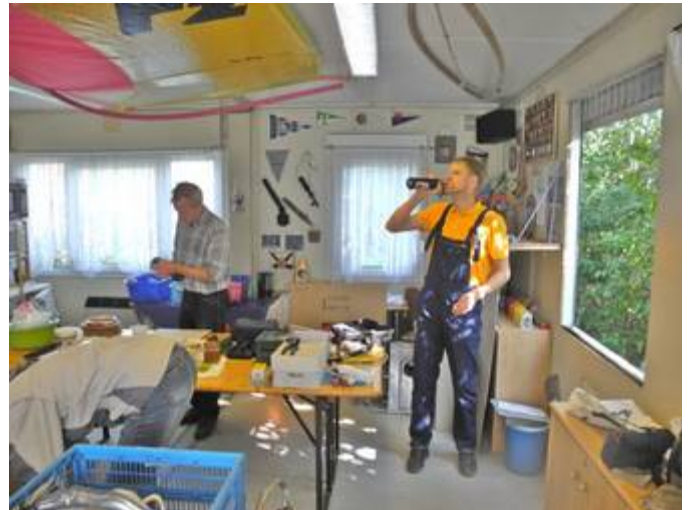
Roland Martin hat Durst