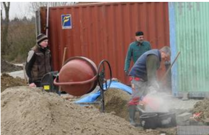
Gleichzeitig Arbeiten bei der SVM