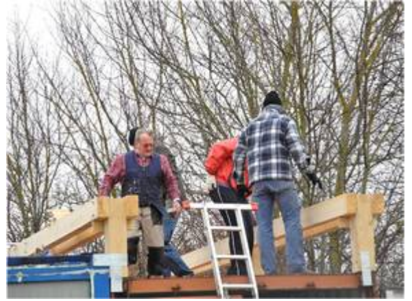
Arbeiten in luftig-stürmischer Höhe