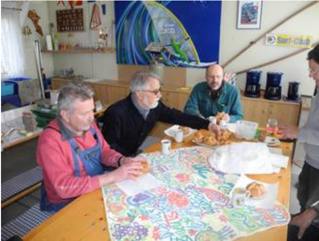
Zum Abschluss die gemeinsame Brotzeit