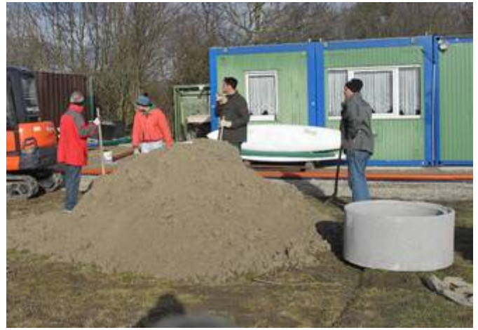
Verteilen des Füllsandes