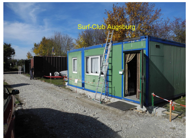
Clubheim / Material