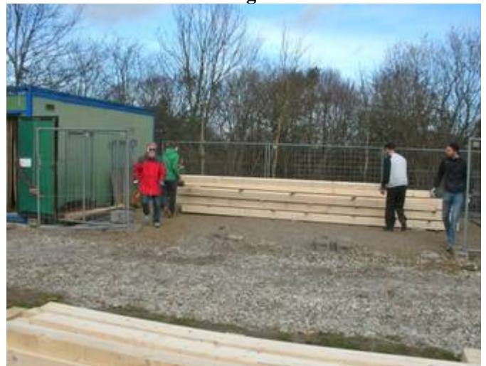
Bernd Martin Jürgen Ralf