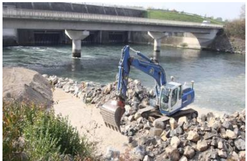
Am östlichen Lechufer unterhalb der Staustufe 23 haben die Arbeiten für eine Fischtreppe begonnen.

Auf Facebook kursierten bereits Befürchtungen, am Lechufer bei der Staustufe 23 (Mandichosee) haben Vorarbeiten zur neuen Lechbrücke für die künftige Osttangente Augsburg / B2 begonnen. Doch bald gab es Entwarnung. Am