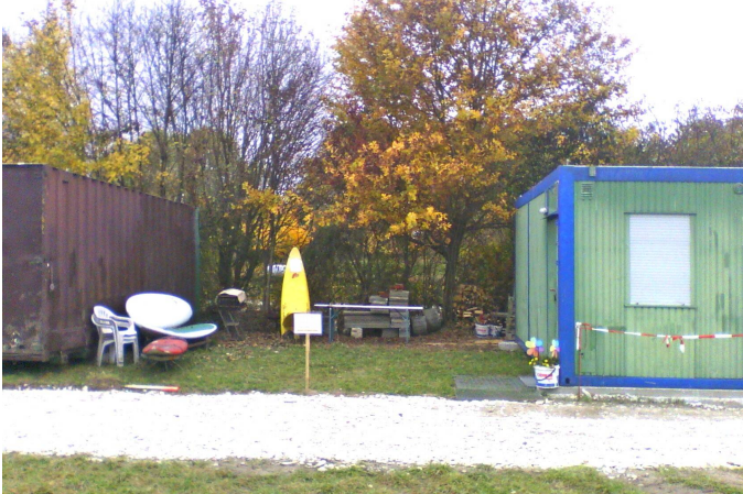
Freiraum / überdachte Terrasse

Am Freitag, den 23. Oktober haben sich fünf Clubfreunde an unserer neuen Clubanlage getroffen um einen Teil des im neuen Container gelagerte Materials umzuschichten. Der Grund war, dass in dieser Woche die Balken und auch das Trapezblech für das Dach bestellt worden sind. Damit bis zur Dachmontage die Holzbalken nicht „lose“ auf der Wiese umherliegen, wird der Platz im neuen Container als Zwischenlager benötigt. Schöne Holzbalken können viele brauchen.