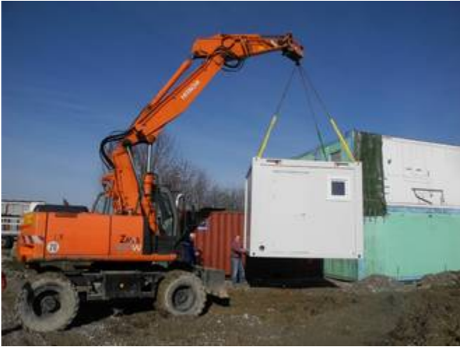
Aufstellen des ersten Sanitärcontainers