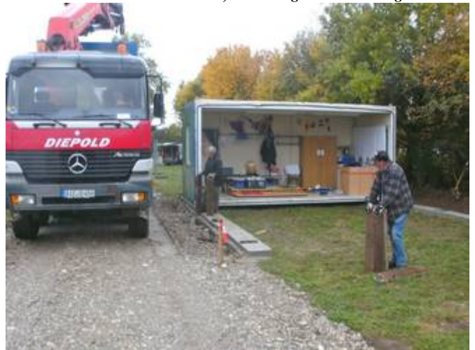
alles passt wie geplant und vorbereitet