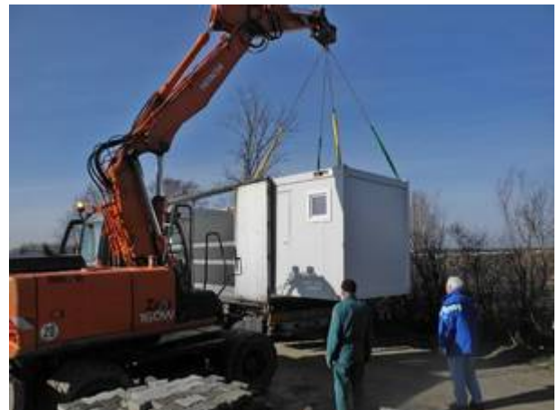
Aufstellen des ersten Sanitärcontainers