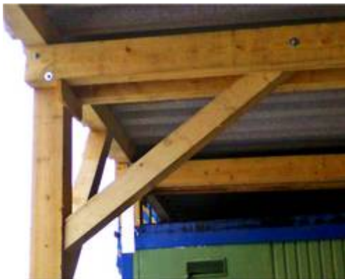
Beispiel einer Verstrebung

Wer rastet, der rostet. Das ist ein altes Sprichwort. Nun, unsere „Rentnergang“ war gleich am Montag, den 14. März wieder ab 10 Uhr bei der Arbeit. Heute begannen wir das Dachgerüst mit Winkelstreben weiter zu stabilisieren. Anfangs war es mit drei Grad und Nordwind doch recht frisch. Ab Mittag wurde es wärmer und das Feierabend Bier genossen wir ab 15 Uhr auf unserer Surferbank. Dabei hatten sie wieder ein Naturerlebnis. Im Süden zog eine große Gruppe Rehwild langsam vorbei. Kaum zu glauben. Als wir einen Tag später, am Dienstag, den 15. März weiter arbeiteten fing es bereits kurz nach 10 Uhr an zu schneien. Das hatten die Wetterfrösche sogar vorhergesagt. Unter dem Dach konnte man aber gut arbeiten und bald waren die letzten Verstrebungen montiert und an der Nordseite die oberen Gitter montiert. Kurz nach 14 Uhr waren wir damit fertig. Jetzt hatten wir unangenehmes, nasskaltes Schmuttel Wetter. Die Wiese war inzwischen rundherum eingeschneit.