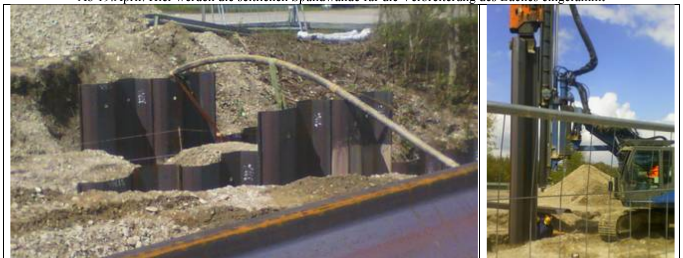
Ab 19. April: Hier werden die seitlichen Spundwände für die Verbreiterung des Baches eingerammt

BBBBBBBBBBBBBBBBBBBBBBBBBBBBBBBBBBBBBBBBBBBBBBBBBBBBBBBBBBBBBBBBBBBBBBBBBBBBBBBBBBBBBBBBBBBBBBBB