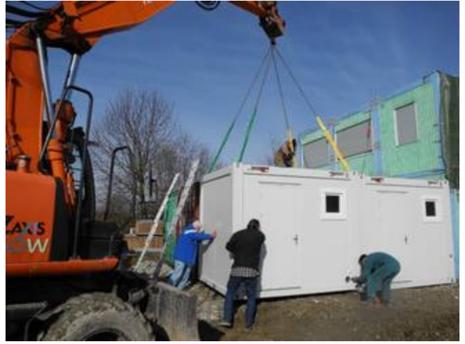
und des zweiten Sanitärcontainers