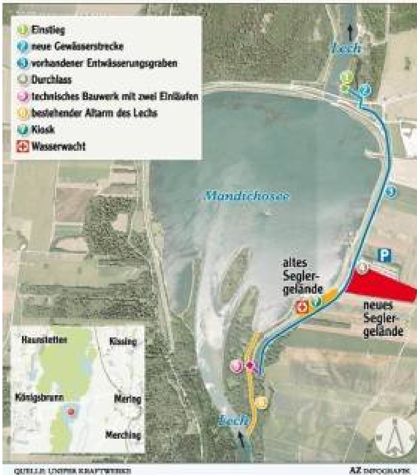
Am Ostufer des Mandichosees entsteht ein Wassergraben, in dem die Fische die ganze Staustufe "umschwimmen" können. AZ Infografik

den Entwässerungsgraben sollen etwa 70 Stück eingesetzt werden. Dieser wird als längster Abschnitt der Fischtreppe naturgerecht aufgewertet. Der im Lech heimische Huchen dient dabei als Orientierung für die Planung. Aber auch sonst liegen inzwischen am Seeufer rundum solche Bündel.