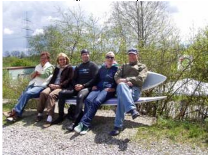
Surferbank oben am Ufer