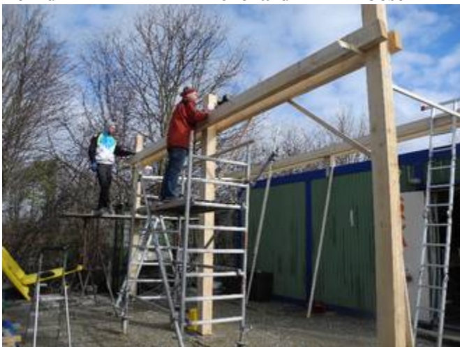
Ralf Josef Dachgerüst der Terrasse