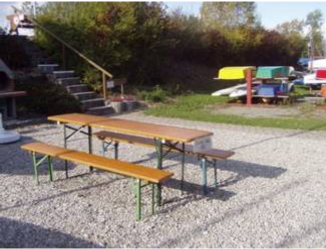
Kiesfläche mit Brotzeittisch