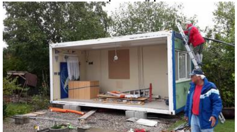
nun kommt die zweite Hälfte dran